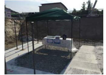
リフレッシュコーナー設置