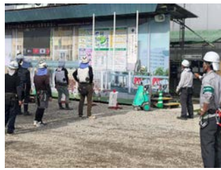
朝礼場ミストファン設置