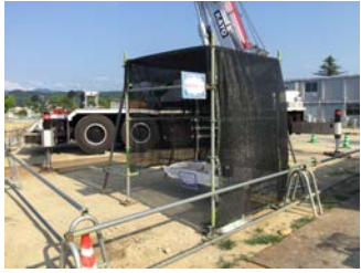
リフレッシュコーナー設置