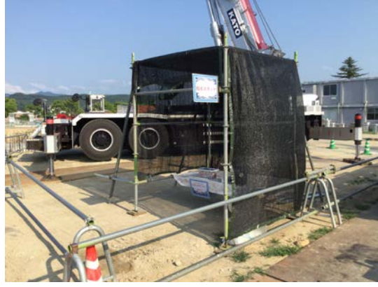
リフレッシュコーナー①