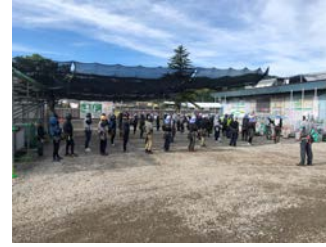
朝礼場日除けテント設置