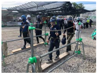
朝礼後の平均台歩行による体調確認