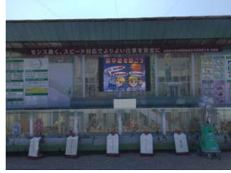
サイネージによる熱中症予防啓発