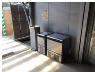
製水機・冷水器設置