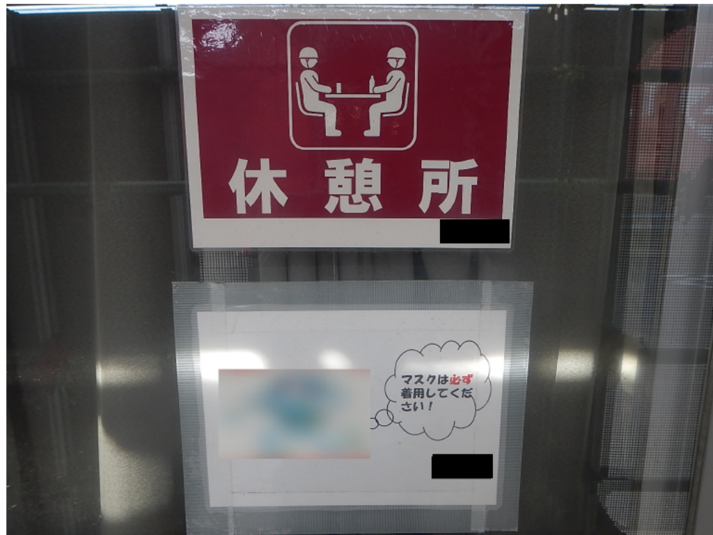
マスクをしましょう!