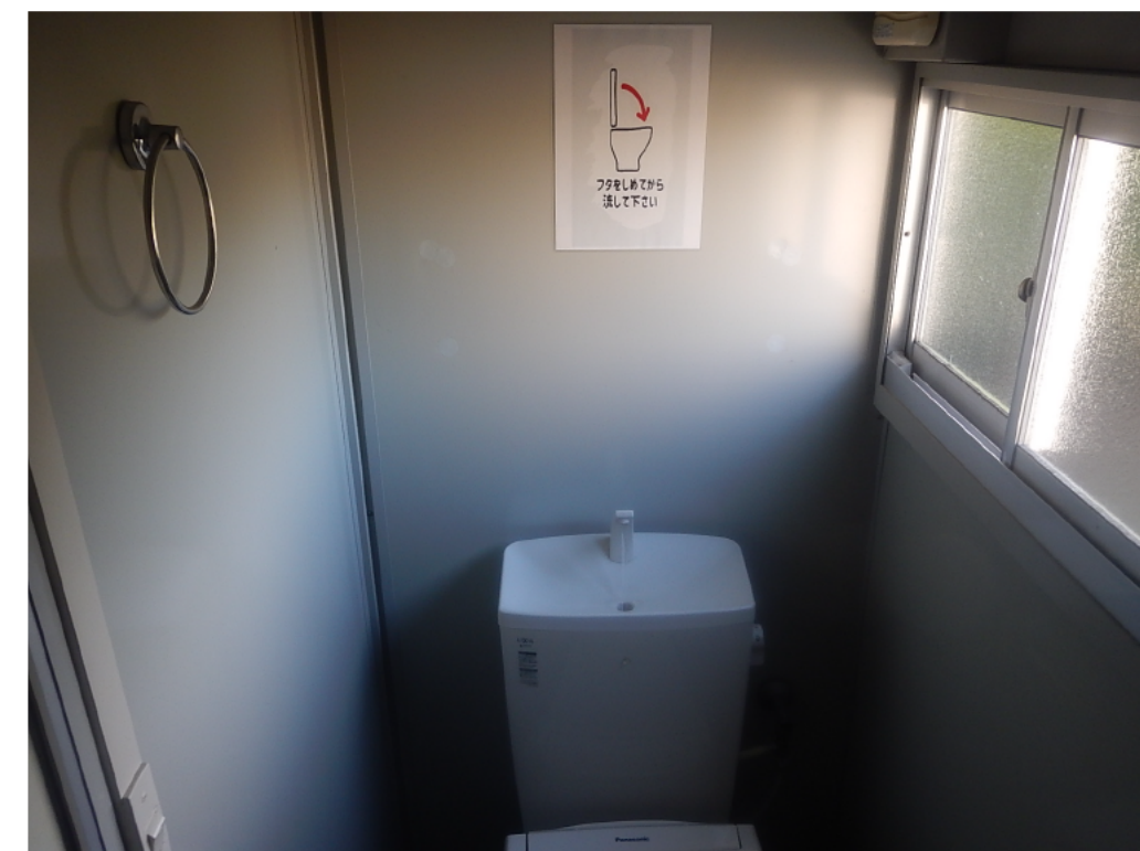
トイレのフタをしてから流しましょう!

新型コロナウイルス感染拡大防止対策として、日頃作業員の目がいきやすいところに危険有害性情報を見える化、注意喚起を促しています