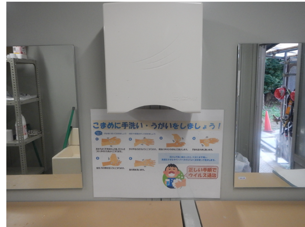
こまめに手洗い・うがいをしましょう!